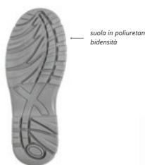
suola in poliuretano bidensità