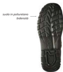
suola in poliuretano bidensità