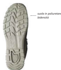
suola in poliuretano bidensità