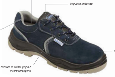
cuciture di colore grigio e inserti rifrangenti