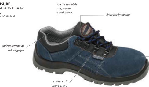
soletta estraibile traspirante e antistatica