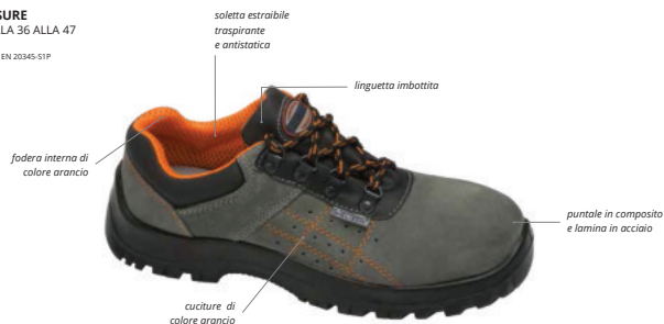
soletta estraibile traspirante e antistatica