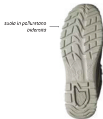
suola in poliuretano bidensità